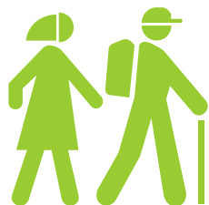
Orientation de la carte automatique (sens de la marche)

Une navigation adaptée : GPtO ® corrige en temps réel les informations GPS qui ne sont pas toujours très fiables ou très précises. Le logiciel recalcule la position de l'utilisateur, et le guide simplement sur le circuit en corrigeant les écarts du GPS, même en zone difficile comme par exemple sous un couvert forestier dense. Cette précision est paramétrable, circuit par circuit, ce qui permet d'obtenir un guidage très efficace, et ce quelle que soit la topographie du parcours.