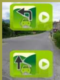
Exemple (Digne les Bains)

Choix de la suite d'un parcours (ou gestion aller/retour)