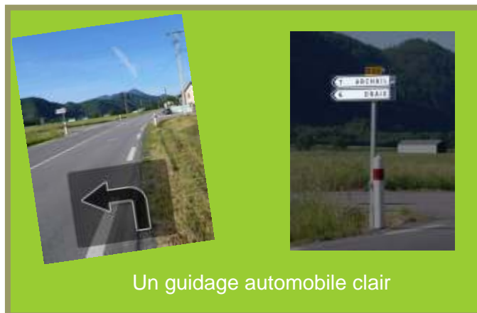
Un guidage automobile clair