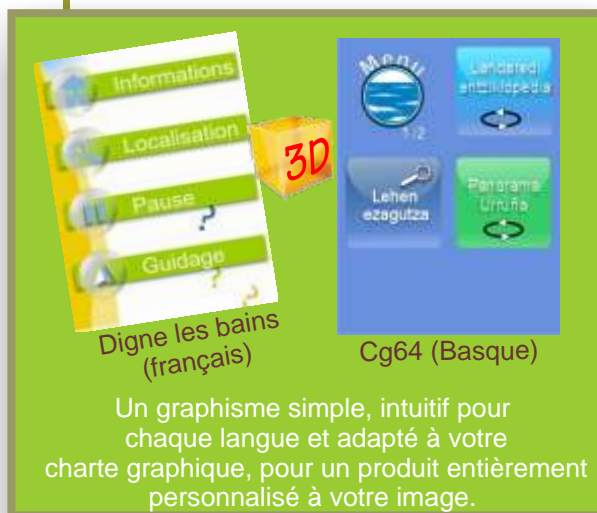
Digne les bains (français)

Fonctionnement automatique : GPTO ® est conçu et développé pour une utilisation la plus simple et intuitive possible. Ainsi, pour la plupart des utilisateurs, peu férus de nouvelles technologies, tout est automatisé. Le déclenchement des stations (POI), la lecture et la fermeture des scénarios se fait sans aucune manipulation. En revanche, pour les utilisateurs plus avertis, l'interface « grande surface tactile » est un plaisir, tout comme la navigation dans les menus accessibles en mode manuel !